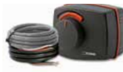
3-punktowe, wyłącznika pomocniczego